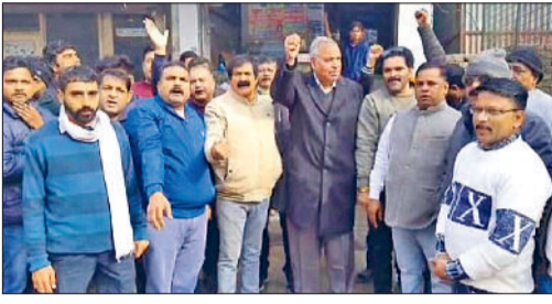
रोहतक। विरोध प्रदर्शन करते व्यापारी।

व्यापारियों का आरोप, शिकायत के बाद भी कार्रवाई नहीं कर रही पुलिस, हमसे ही सवाल-जवाब किए गए