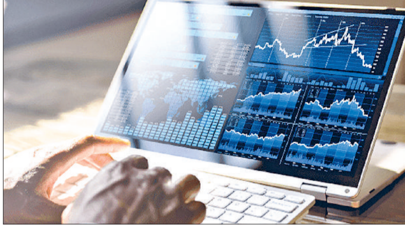
शेयर बाजार की अनिश्चितताओं से परेशान निवेशकों के लिए बेहतर ऑप्शन

लाम और टैक्स की सुविधा इन फंडों का एक बड़ा फायदा है नियमित प्रॉफिट बुकिंग। जब बाजार में इक्विटी का हिस्सा तय सीमा से ज्यादा बढ़ जाता है, तो फंड मैनेजर स्टॉक्स बेचकर असाइन्मेंट बनाए रखते हैं। यह लंबी अवधि में रिटर्न बढ़ाने में मदद करता है।