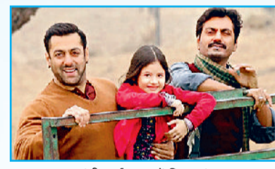
'बजरंगी भाईजान' में दिखा मंडावा