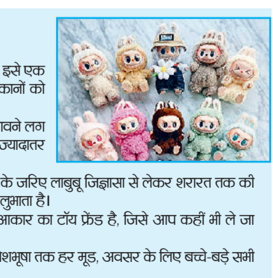
नुकीले कान: चुस्त और सतर्क लाबुबू के नुकीले कान इसे एक प्यारी लेकिन शरारती रूप देते हैं। लाबुबू के नुकीले कानों को देखकर बच्चों को खूब मजा आता है।

सांस्कृतिक प्रतीक: लाबुबू खिलौना संग्रहकों और कला प्रेमियों के बीच एक सांस्कृतिक प्रतीक बन गया है, जो आनंद, शरारत और रचनात्मकता को एक साथ रिजेंट करता है। इसीलिए लाबुबू अधिकांश लोगों को पसंद आता है। लाबुबू महज एक आकृति या डॉल नहीं है। यह एक भावना है, एक स्मृति है, जो प्राचीन नार्वीडियन संस्कृति से जुड़ी है। *