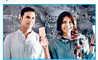
महेश्वर घाट में हुई 'पैडमैन' की शूटिंग

सैंट पॉल स्कूल: दार्जिलिंग के जलपहार में स्थित सैंट पॉल स्कूल वही स्कूल है, जहां शाहरुख खान की सुपरहिट फिल्म 'मैं हूँ न' की शूटिंग हुई थी। समुद्र तल से 7800 फीट की ऊंचाई पर स्थित सैंट पॉल स्कूल को दुनिया में सबसे ऊंचाई पर स्थित स्कूल माना जाता है। स्कूल से दिखने वाली कंचनजंगा की पहाड़ियां और स्कूल बिल्डिंग का बेहतरीन आर्किटेक्चर फिल्म निर्माताओं को यहां खींच लाता है। यहां शूटिंग की परंपरा काफी पुरानी है। बी. आर. चोपड़ा की 'हमराज', राजकपूर की 'मेरा नाम जोकर', दुलाल गुहा की 'दो अनजाने', प्रियंका चोपड़ा, रणबीर कपूर स्टार 'बर्फी' जैसी फिल्मों के अहम हिस्से यहां फिल्माए गए हैं। महेश्वर घाट: नर्मदा की चंचल लहरों के किनारे स्थित इंदौर का खूबसूरत महेश्वर घाट कई सुपरहिट फिल्मों में अपनी उपस्थिति दर्ज करा चुका है। राजस्थान का मंडावा, आधुनिक जीवनशैली और विकास की चमक-दमक से दूर अपनी हवेलियों, किलों के लिए मशहूर है। पिछले एक दशक में यहां दर्जनों हिट फिल्मों शूट हो चुकी हैं।