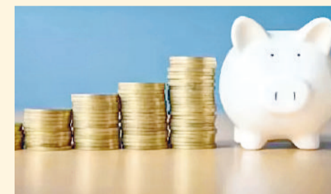
खासकर रिटायर लोगों के लिए उपयोगी है, क्योंकि उन्हें पेंशन जैसी स्थिर आय मिलती रहती है। एसडब्ल्यू से निवेशक का मूल निवेश सुरक्षित रहता है और जरूरत के मुताबिक पैसा मिलता रहता है।

एसडब्ल्यू: नियमित आय का साधन दूसरी ओर, एसडब्ल्यू उन निवेशकों के लिए है जो अपने निवेश से नियमित आय चाहते हैं। इसमें निवेशक अपने म्यूचुअल फंड से हर महीने या तिमाही तय राशि निकाल सकते हैं। यह तरीका