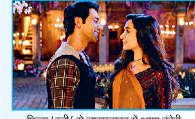
फिल्म 'खी' से लाइमलाइट में आया चंदेरी

चंदेरी: किसी ब्लॉकबस्टर मूवी के सीन में अपने छोटे से शहर या कस्बे का पुल, हवेली, गलियां, रेलवे स्टेशन या इमारत दिख जाए तो मन हुलास से भर उठता है। बिल्कुल यही हुलास चंदेरी के लोगों में मन में भी तब उठा, जब उन्होंने अपने कस्बे में खुले पहले सिनेमा हॉल में लगी पहली ही फिल्म 'खी' देखी। 'शुद्ध देसी रोमांस', 'कच्चे धागे', 'दिल्ली चलो' जैसी फिल्मों की शूटिंग हो चुकी है। 180 साल पुरानी इस हवेली की दीवारों पर चित्रकारी मुगल, पर्शियन और इंडियन आर्ट के समावेश से की गई है। यही कारण है कि कबीर खान जब 'बजरंगी भाईजान' में पाकिस्तान की गलियों का सीन दिखाना चाहते थे तो मंडावा में शूटिंग के लिए आए।