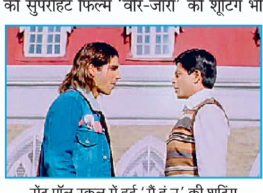
सैंट पॉल स्कूल में हुई 'मैं हूँ न' की शूटिंग

पटौदी पैलेस में ही हुई थी। 'मंगल पांडे: द राइजिंग' का एक बड़ा हिस्सा शूट करने के लिए पटौदी हाउस को चुना गया था। इसके अलावा 'गांधी माय फादर', 'मेरे ब्रदर की दुल्हन', 'तांडव' जैसी कई फिल्मों में भी यहां फिल्माई गई। कुछ अन्य ऑफबीट फिल्मी लोकेशंस: 26/11 के आतंकी हमलों पर आधारित फिल्म 'फैटम' को पंजाब के एक गांव मलेरकोटला में शूट किया गया है। कानपुर के बिदुर, काकादेव, शिवाला, माल रोड, मोतीझील, भैरव घाट में भी कई फिल्मों शूट हो चुकी हैं। महाराष्ट्र के वाई गांव में चर्चित फिल्म 'स्वदेश' की शूटिंग हुई थी। 'दबंग' फिल्म में वाई गांव को उत्तर प्रदेश के लालगंज के रूप में दिखाया गया है, जबकि 'स्वदेश' फिल्म में यह उत्तर प्रदेश के चरणपुर के रूप में दिखाया गया था। *