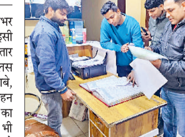
रोहतक। गणतंत्र दिवस को लेकर होटल को चेक करते पुलिस अधिकारी।

गणतंत्र दिवस को लेकर रोहतक पुलिस ने जिलेभर में सुरक्षा व्यवस्था को और मजबूत कर दिया है। इसी कड़ी में पुलिस द्वारा विशेष चैकिंग अभियान लगातार जारी है। इस अभियान के तहत अलग-अलग पुलिस टीमों को तैनात कर होटल, गेस्ट हाउस, ढाबे, धर्मशाला और अन्य ठहरने वाले स्थानों पर गहन जांच की जा रही है। पुलिस का मकसद जिले में किसी भी संदिग्ध गतिविधि पर समय रहते रोक लगाना और कानून-व्यवस्था को बनाए रखना है। पुलिस अधिकारियों के अनुसार, विशेष अभियान के तहत शहर व ग्रामीण इलाकों में स्थित सभी होटल, धर्मशाला और गेस्ट हाउस को चेक किया जा रहा है। यहां ठहरने वाले प्रत्येक व्यक्ति की पहचान की जा रही है। पुलिस टीमों में मौके पर रजिस्टर की जांच कर रही है और यह सुनिश्चित किया जा रहा है कि ठहरने वाले हर व्यक्ति का पूरा नाम, पता और पहचान पत्र का विवरण रिकॉर्ड में दर्ज हो।