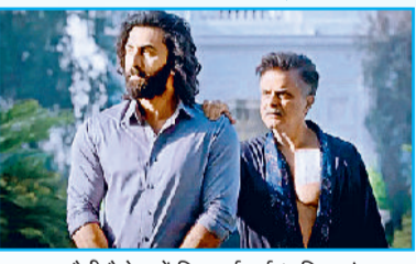
पटौदी पैलेस में फिल्माई गई 'एनिमल'

मंडावा की शानदार स्नेही राम लाडिया हवेली में 'पिके', 'बजरंगी भाईजान', 'लव आजकल', 'जब वी मेट', 'शुद्ध देसी रोमांस', 'कच्चे धागे', 'दिल्ली चलो' जैसी फिल्मों की शूटिंग हो चुकी है। 180 साल पुरानी इस हवेली की दीवारों पर चित्रकारी मुगल, पर्शियन और इंडियन आर्ट के समावेश से की गई है। यही कारण है कि कबीर खान जब 'बजरंगी भाईजान' में पाकिस्तान की गलियों का सीन दिखाना चाहते थे तो मंडावा में शूटिंग के लिए आए।