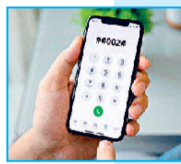
डिलीवरी मैसेज या नेक कोड को खिना सोचे-समझे डायल करना भारी पड़ सकता है। इसलिए हमेशा सतर्क रहें।

मामलों में यूजर को तब पता चलता है, जब उसके अकाउंट से पैसे निकल चुके होते हैं या उसका सोशल मीडिया अकाउंट किसी और के कंट्रोल में चला जाता है। रहें सावधान: इस नई तकनीकी ठगी की सबसे चौकाने वाली बात यह है कि इसमें न तो किसी लिंक पर क्लिक करने की जरूरत होती है और न ही कोई एप इंस्टॉल करना पड़ता है। सिर्फ एक कोड डायल करने से ही यूजर बड़ी परेशानी में फंस सकता है। इसी कारण संस्था विशेष सतर्कता बरतने को सलाह दी है, क्योंकि आमतौर पर लोग नेक कोड को खतरनाक नहीं मानते। लेकिन अब ठगों ने इन्हें भी हथियार बना लिया है। *